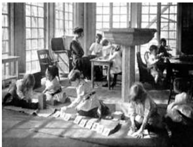
Maria Montessori in ihrem Kinderhaus Casa die Bambini in Rom 1907

Heute gibt es Montessorieinrichtungen rund um die Welt. Überall werden die einzigartigen Montessorimaterialien verwendet und die Ideen einer vom Bedürfnis des Kindes ausgehenden Pädagogik finden immer mehr Freunde. Freiarbeitsphasen werden im heutigen Schulalltag immer mehr genutzt.